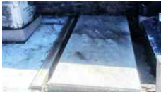
Lettere al direttore